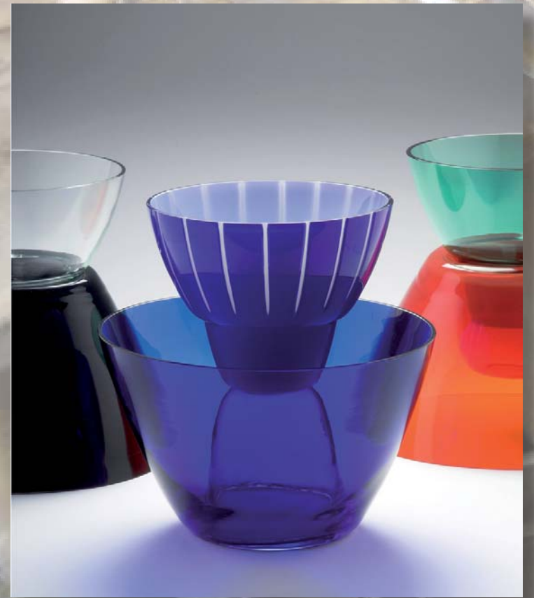
Up Side, That Way 2009