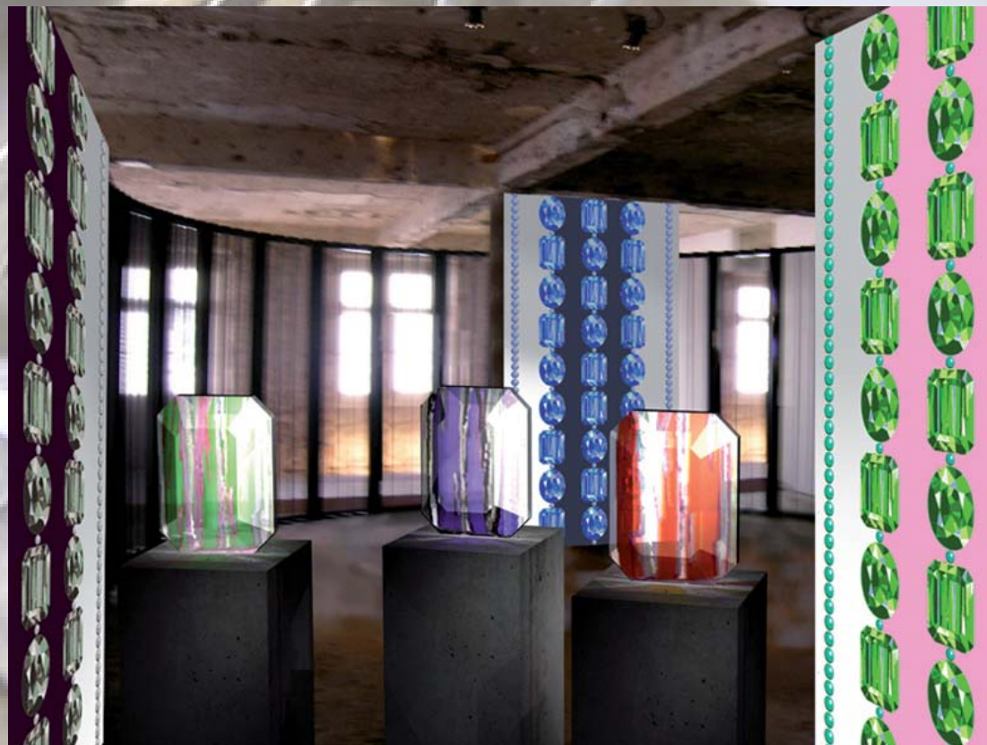
Jalokivet (Jewels) lasiveistoksia ja sisustuskankaita 2011