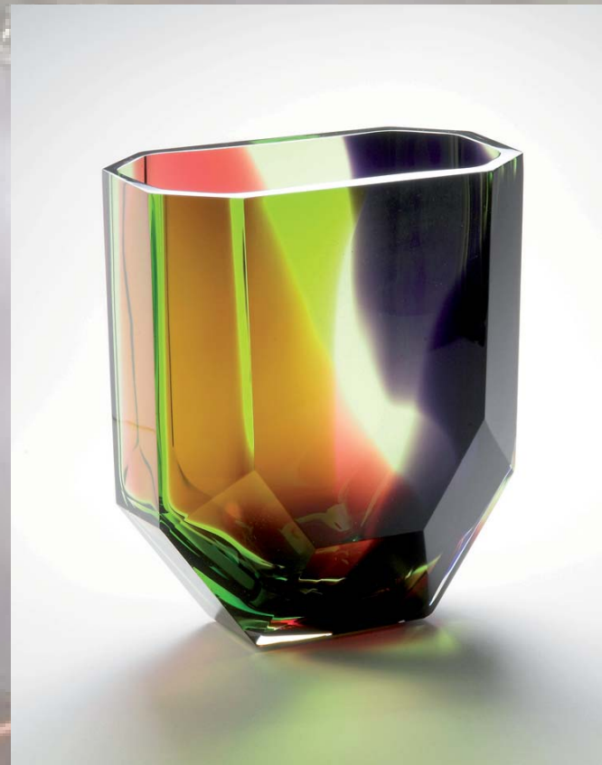
Jalokivi -malja, suupuhallettu ja hiottu, toteutus Lasismi-osuuskunnassa, 2011