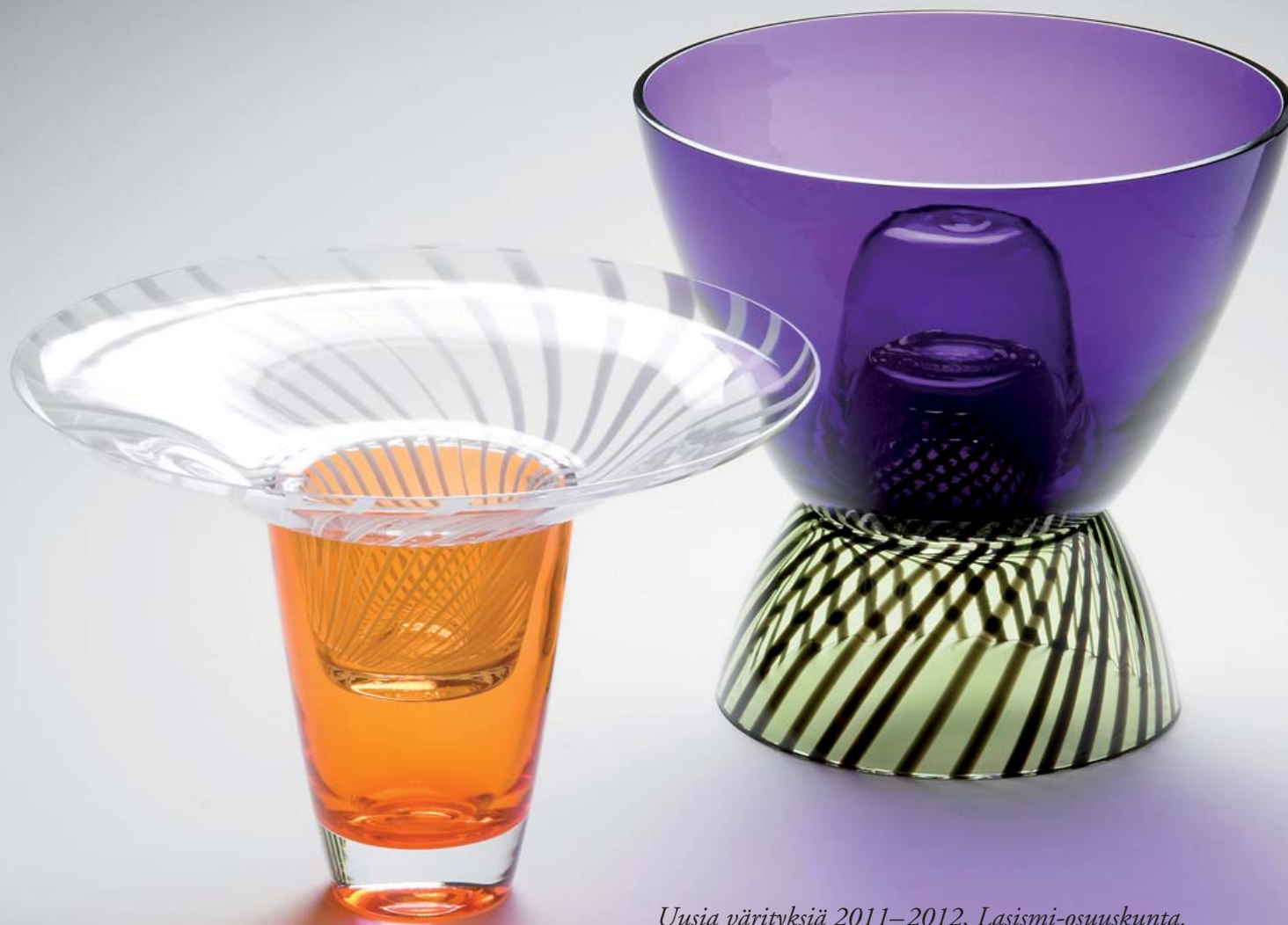
Uusia värityksiä 2011–2012, Lasismi-osuuskunta.