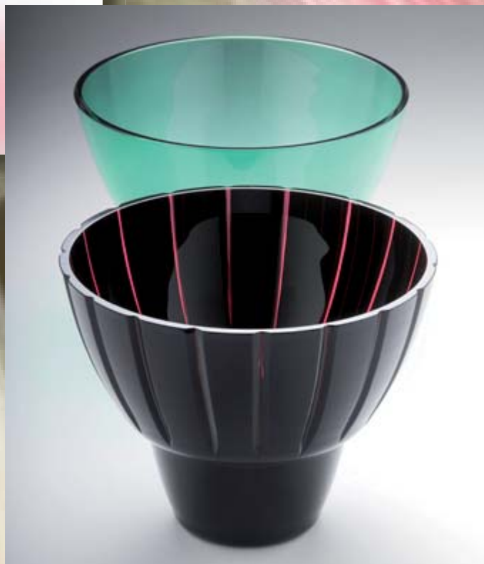
That Way, That Way (cut) 2009