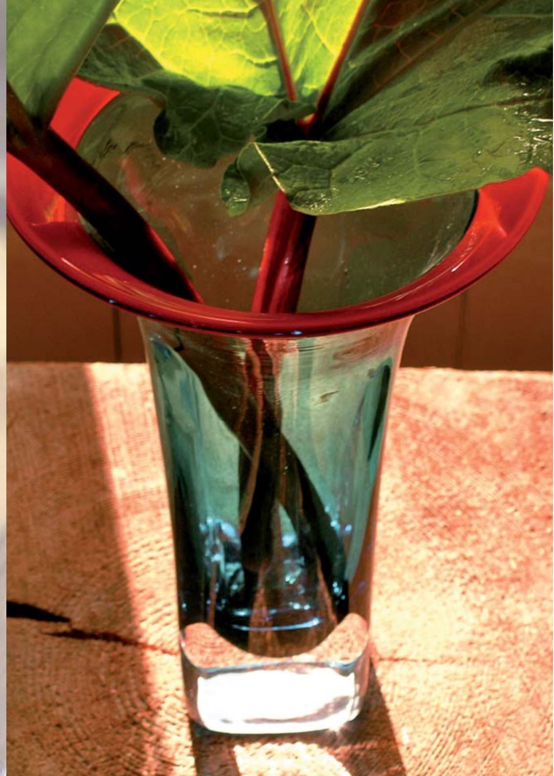
Trumpetti (Trumpet) 2004