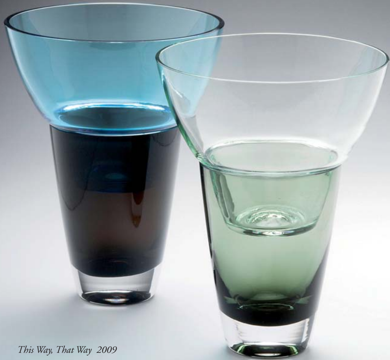
This Way, That Way 2009