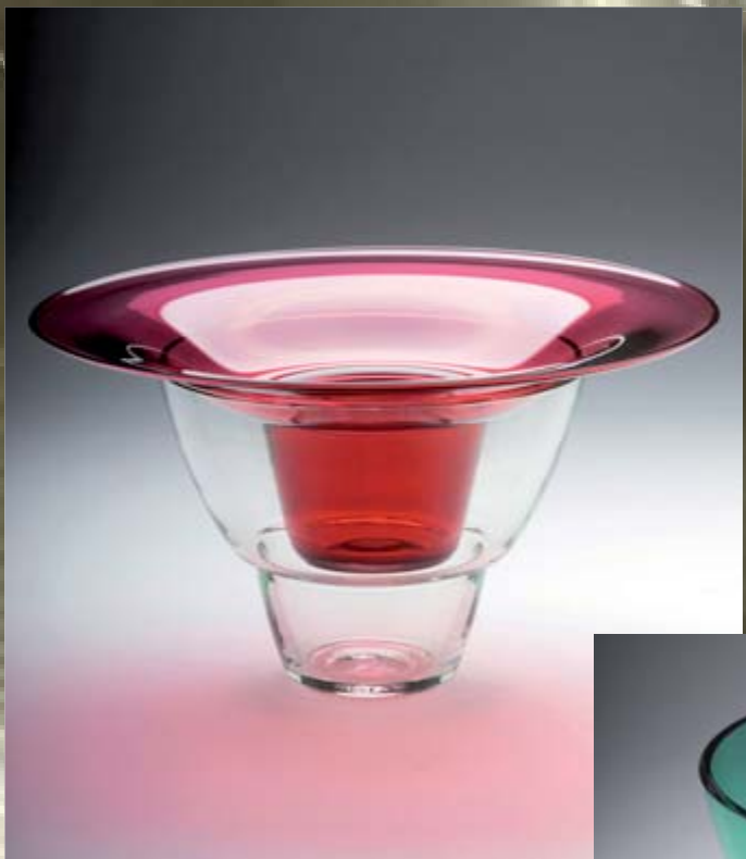
That Way, Side Way, 2009