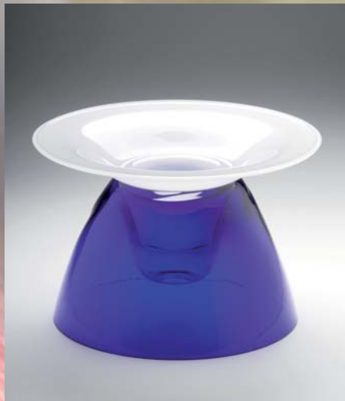
Up Side, Side Way 2009